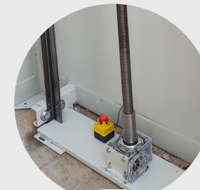
KUYU DİBİ STOP